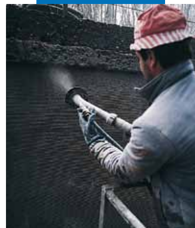
Υδροηλεκτρικό κανάλι Bertini - Robbiate (Como) - Ιταλία: εφαρμογή με ψεκασμό