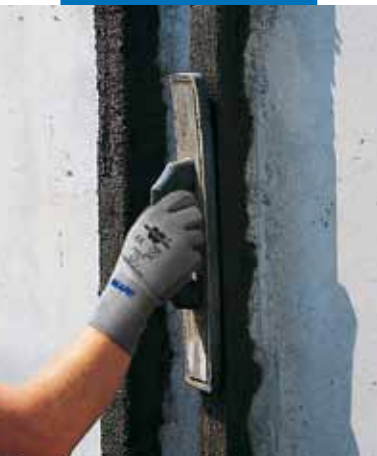
Φινιρίσμα με σπογγώδη σπάτουλα