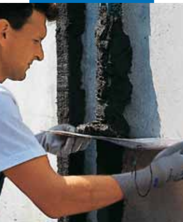
Διαμόρφωση του κονιάματος