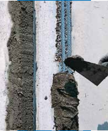
Εφαρμογή με μυστρί