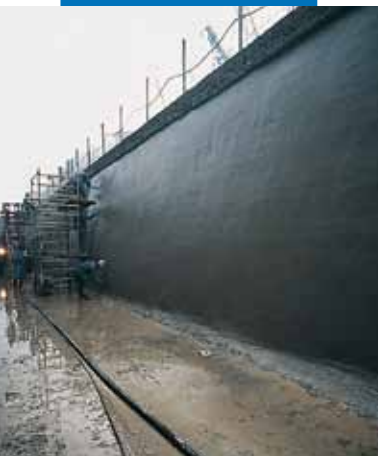
Υδροηλεκτρικό κανάλι Bertini - Robbiate (Como) - Ιταλία: γενική όψη