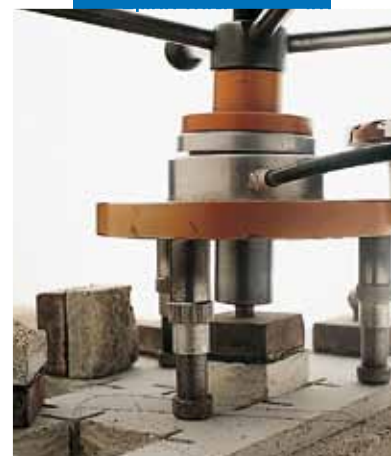
Δοκιμή πρόσφυσης κατά SATTEC