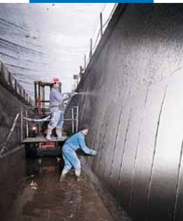
Υδροηλεκτρικό κανάλι Bertini - Robbiate (Como) - Ιταλία: τελείωμα με σπάτουλα